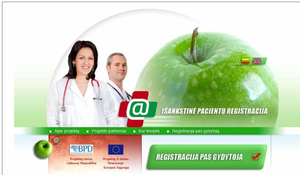
1 pav. www.sergu.lt pagrindinis puslapis

Atsidariusiame lange pelės mygtuku spaudžiama nuoroda „Registracija pas gydytoją“.