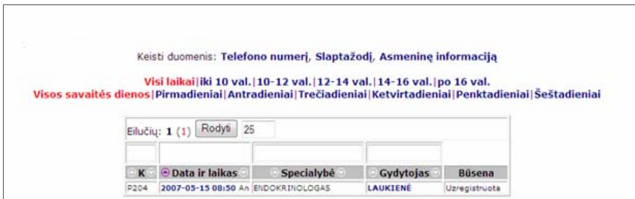
13 pav. Internetu registruotų vizitų peržiūros langas

Pacientų išankstinės registracijos pagrindiniame lange paspaudus nuorodą „Mano vizitai. Internetu registruotų vizitų peržiūra“ ir įvedus autorizacijos sistemoje duomenis (mobilaus telefono numerį ir slaptažodį), atidaromas internetu registruotų autorizuoto naudotojo vizitų peržiūros langas.