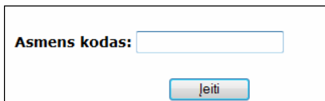
7 pav. Asmens kodo įvedimo langas

Pacientai, norintys užsiregistruoti pas apylinkės gydytoją (pas savo gydytoją), išankstinės pacientų registracijos pagrindiniame puslapyje spaudžia nuorodą „Pas apylinkės gydytoją“. Atidaromas naujas langas, kuriame reikia įvesti paciento asmens kodą ir spausti „Įeiti“.