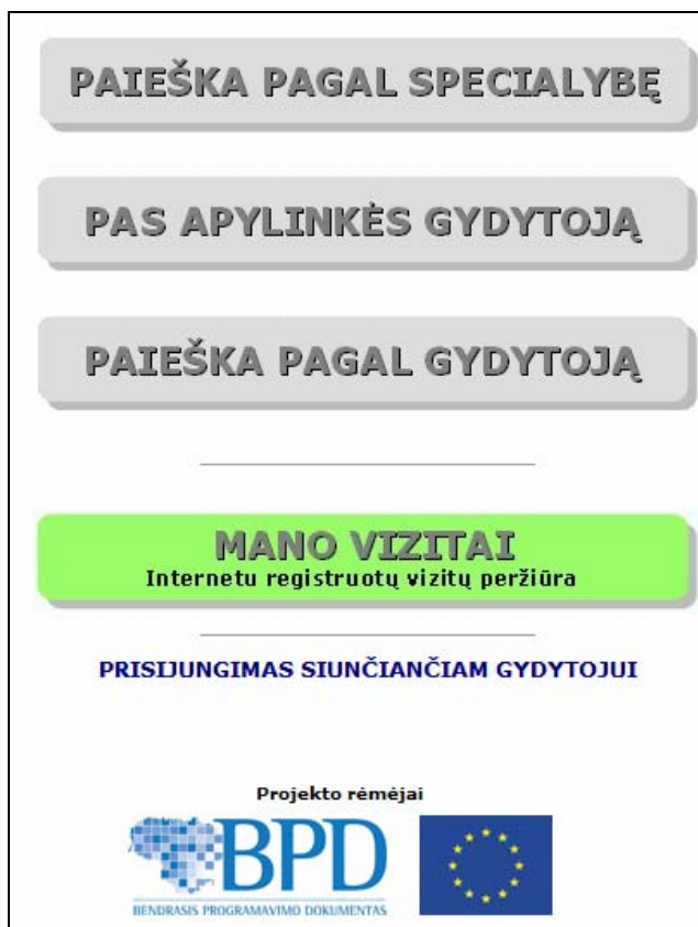
3 pav. Išankstinės pacientų registracijos pagrindinis puslapis